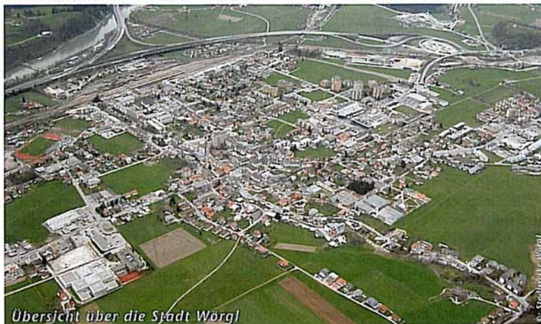
Übersicht über die Stadt Wörgl

wollen wir alle Kräfte bündeln und ganz gezielt auch Bevölkerung und Unternehmen einbinden sowie ein Netzwerk mit Kooperationspartnern und anderen Gemeinden mit ähnlicher Zielsetzung aufbauen. Denn oft braucht man nicht Neues erfinden, sondern nur gute Ideen übernehmen und anpassen.